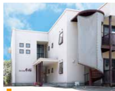
医療法人中山会 グループホーム冬桜

〒004-0021 札幌市厚別区青葉町16丁目2-26 tel.011-892-4111 fax.011-892-4100