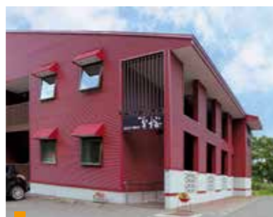
医療法人中山会 グループホーム夏桜

〒004-0003 札幌市厚別区厚別東3条6丁目1-5 tel.011-897-0733 fax.011-897-0757