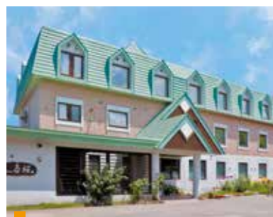
医療法人中山会 グループホーム春桜

〒004-0003 札幌市厚別区厚別東3条6丁目1-5 tel.011-897-0733 fax.011-897-0757